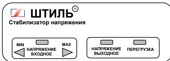
Рисунок 4.1 Передняя панель стабилизатора

На одной боковой стенке стабилизатора расположена розетка с заземляющим контактом для подключения нагрузки, а на другой – автоматический предохранитель 2А (у стабилизатора R250ST) или 5А (у стабилизаторов R400ST, R600ST), или 10А (у стабилизатора R800ST), выключатель СЕТЬ и выведен сетевой шнур для подключения стабилизатора к сети.